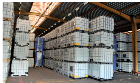
Stockage d'emballages rénovés prêts au réemploi