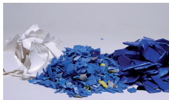
Plastiques broyés en vue de leur recyclage