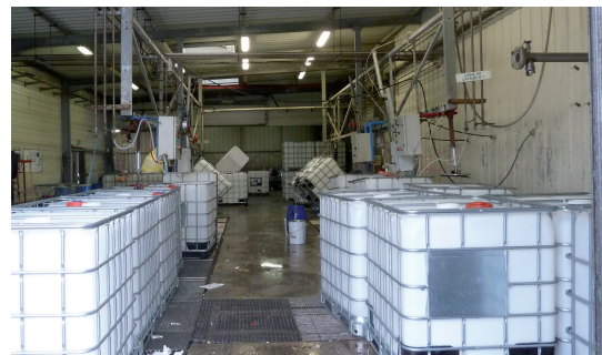
Ligne de lavage des conteneurs 1 000 litres